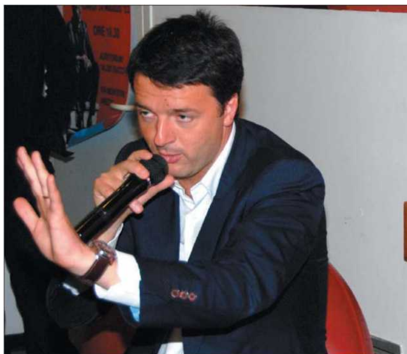
Nelle foto la presentazione di Capalbio Libri 2012 Sopra: il sindaco di Firenze Matteo Renzi, che nella giornata inaugurale, mercoledì 1 agosto, sarà torchiato" dalla giornalista dell'Espresso Denise Pardo