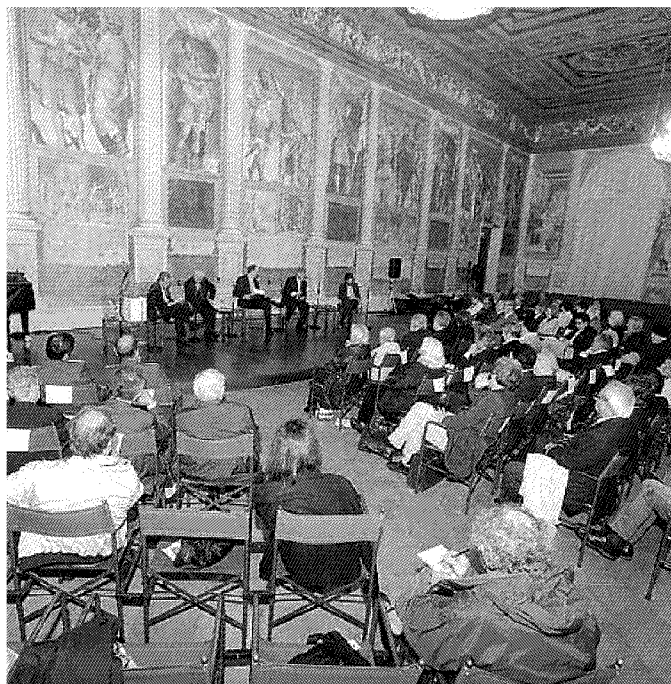
Il pubblico che ha partecipato al dibattito alla Sala dei Giganti

» Il vescovo di Terni Vincenzo Paglia: siamo sull'orlo dell'abisso e dobbiamo recuperare il sogno dell'utopia dell'umanesimo cristiano